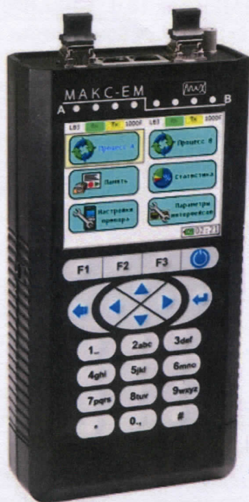
Рисунок 1- Общий вид тестера

Общий вид тестера и схема пломбировки от несанкционированного доступа (Н1 и Н2 пломбы, выполненные из однократно наклеиваемой ленты с уникальным изображением), представлены на рисунках 1 и 2 соответственно.